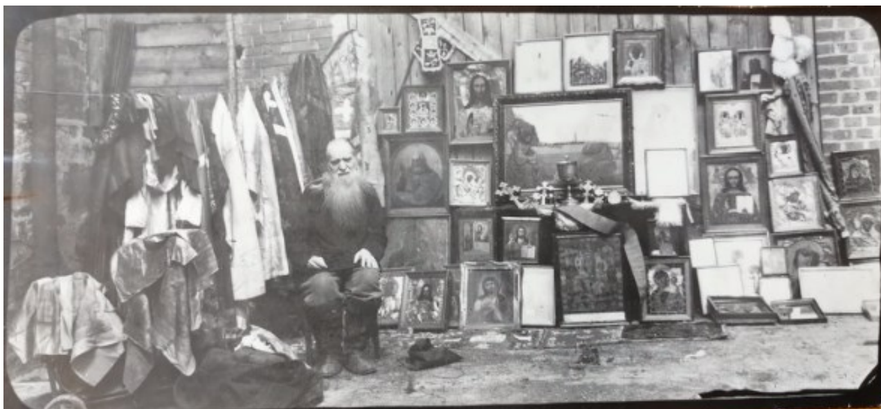
Imagine 1. Patrimoniul religios confiscat și preot arestat, URSS anii 1950

Multe comunități religioase, dar în special minoritățile religioase, au fost reprimate în secolul al XX-lea în timpul regimului fascist și al regimului comunist. Depozitele întinse ale arhivelor securității conțin milioane de dosare ale unor persoane sau instituții urmărite de stat. Dar, mai mult decât atât, aceste arhive prezervă mii de imagini și de obiecte pe care statul le-a confiscat de la oameni de rând sau de la grupuri mai mult sau mai puțin organizate, în scopul de a le distruge: publicații, fotografii, obiecte efemere de viață religioasă: un depozit neștiut de artă religioasă.