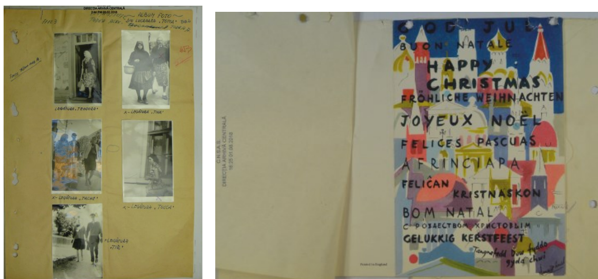
Imaginea 9: Urmărirea Greco-catolicilor, anii 1970, România; Imaginea 10: Felicitări de la Amnesty International interceptate

Această secțiune va urmări tehnicile de supraveghere și practicile fotografice folosite de către poliția secretă, precum și materialele care au fost interceptate de către aceștia. Secțiunea legată de patrimoniul cultural expune cum anume materialele vizuale și creativitatea mișcărilor religioase subterane s-au dezvoltat în perioada post-comunistă. Această secțiune arată viața de după urmărire și închisoare și cum membri ai comunităților cercetate în arhive răspund la materialele vizuale și scrise aflate închise în arhive.