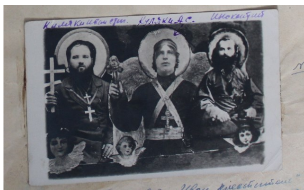
Imaginea 3. Fotocolaj/ artă naivă, material inochentist interceptat în 1942