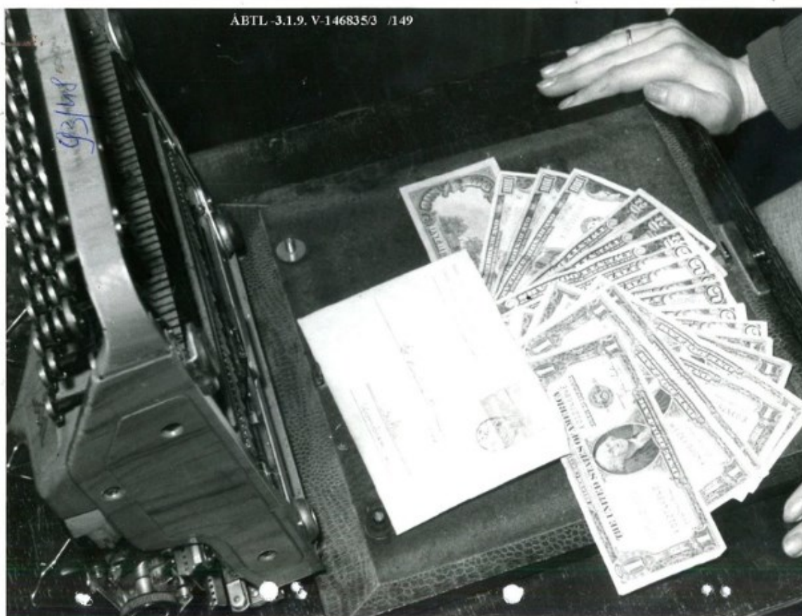
Imaginea 8: Mașină de bătut și dolari, ca dovadă împotriva unor ordine religioase catolice din Ungaria, 1961.