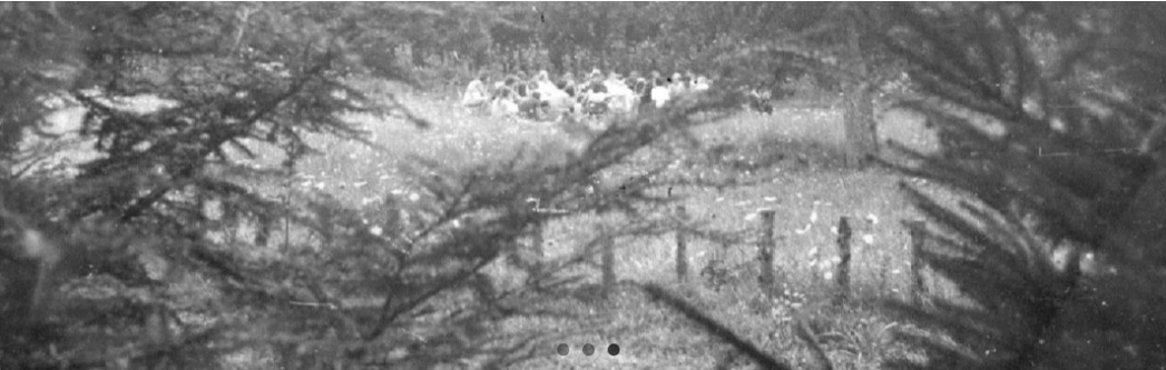
Imaginea 5. Cu corturile în munți, un grup religios urmărit de poliția secretă, Ungaria 1980