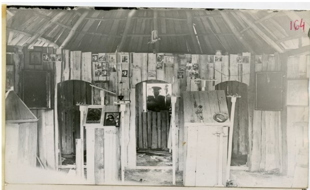
Imaginea 2. Jandarm și biserică stilistă distrusă în 1935

Tema acestei săli este legată de procesul prin care diferite grupuri religioase precum Greco-catolicii, Ortodocșii de Stil Vechi, grupuri evanghelice (etc) care au trecut în ilegalitate, au început să fie urmăriți, materialele lor sacre, confiscate și distruse. Acest proces a condus la ceea ce mai târziu s-a numit religie clandestină sau religie de catacombe. Tot aici, ne punem problema parțialității informațiilor găsite în arhive.