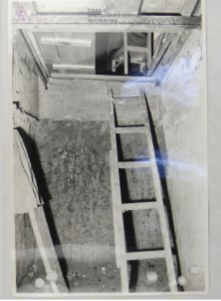
Imaginea 4. Scară care conduce către o capelă ascunsă, București, anii 1970